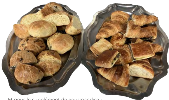
Et pour le supplément de gourmandise : de la viennoiserie

ont à cœur de s'engager contre le gaspillage et n'hésitent pas, quand il le faut, à se lever tôt pour donner et recevoir. C'est toute une activité qui tourne sans relâche autour du pain au Foyer, c'est-à-dire beaucoup de bonne volonté et des efforts sans cesse renouvelés qui permettent tant bien que mal d'en avoir assez à offrir, malgré quelques irrégularités dans le rythme des livraisons ou dans les quantités livrées, parfois aussi dans la qualité.