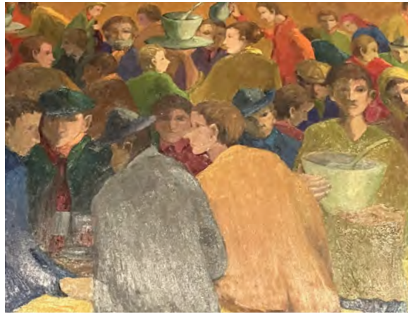
Une soupe au Foyer

Devenu « français de l'intérieur », comme on le dit en Alsace, il a toujours gardé son accent... très prononcé. « Alors il s'en défendait sans vergogne : Yo, yo, c'est donc la machine qui déforme mon expression ! », raconte Michael, qui évoque la surprise de Charles en découvrant sa voix au magnétophone. « Min Akzent ? Awer s'isch dr Magnétophon, wu mini Stimm verformt », en dialecte haut-rhinois, proche de Mulhouse ! L'Alsace profonde à Paris, mais avec une grande ouverture au monde et aux autres, jamais prise en défaut. ■