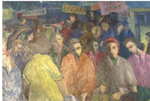
Les Miettes, une fête