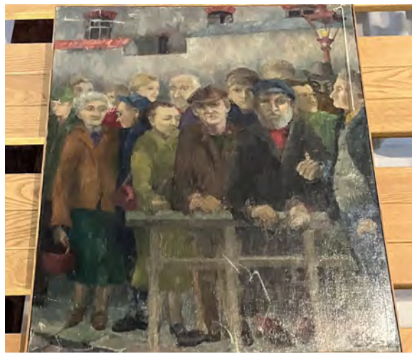
Le peuple du 15 e nous regarde