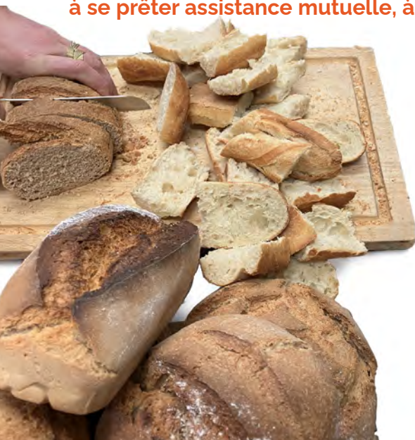
Pains ronds, longs, baguettes, briochés de maïs, aux graines... Il y en a pour tous les goûts. Préférées : les baguettes.

Aux petits déjeuners et dîners solidaires du Foyer, le pain est le levain du vivre ensemble. Intimement lié à la symbolique du partage, de l'hospitalité, de l'amitié et de la fraternité, il invite à se prêter assistance mutuelle, à s'entraider. Par Anne-Lise Häcker