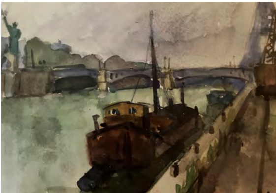
Tableau de Charles Claden accroché chez Michael Wall