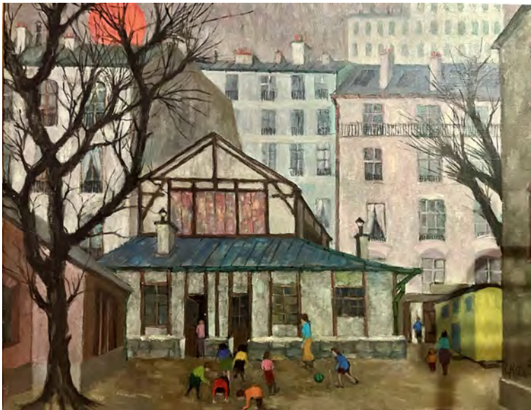
Le Foyer, il y a plus cinquante ans